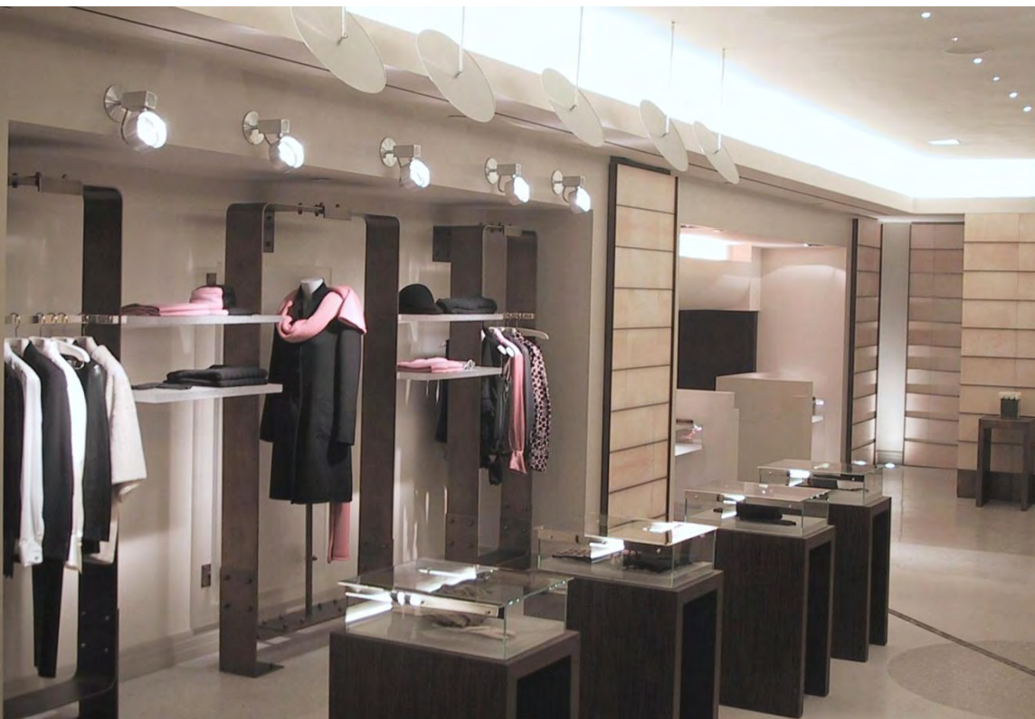
1 - rez-de-chaussée perspectives sur l'entrée