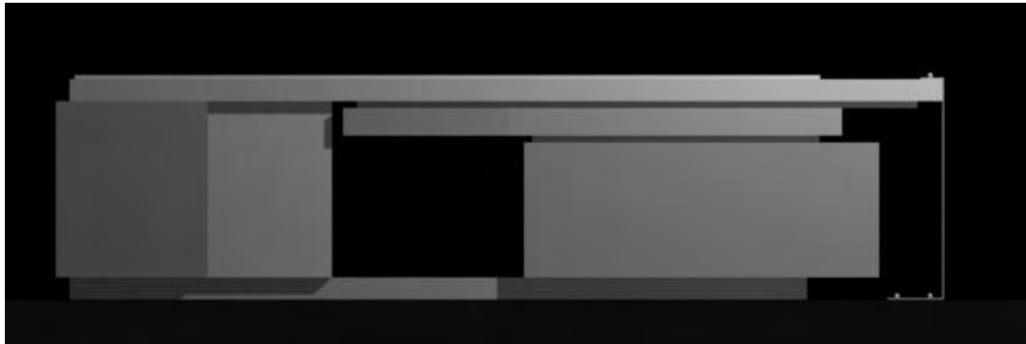
6 | 7 | 8 - détails sol penderie en argent éclairage provenant du sol