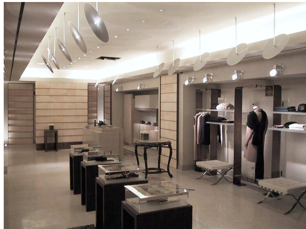
2 - éclairage qualité de lumière spéciale grâce aux disques réflecteurs en carbonium